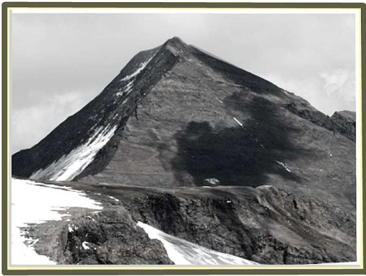
Fuschekarkopf heute, Eiswulst komplett abgeschmolzen